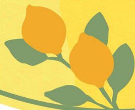
Planche de saumon Gravlax Maison (180gr), crème mascarpone citronnée 21.00€

Planche à l'Italienne charcuterie italienne, affogliata au pesto et légumes marinés 19.00€