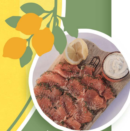
PLANCHE DE SAUMON GRAVLAX